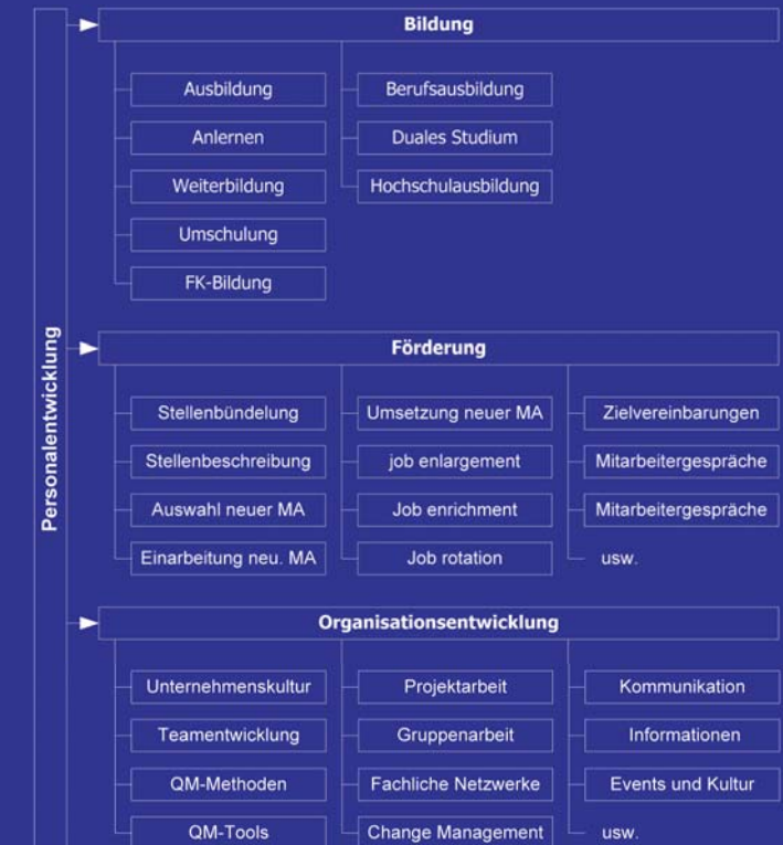
Abb. 3: Bereiche der Personalentwicklung (Auszug)

Deren Ziel ist es, mittels der 3 Bereiche Bildung, Förderung und Organisationsentwicklung (Abbildung 3) und im Einklang mit den Unternehmenszielen bzw. den individuellen beruflichen und familiären Wünschen der Mitarbeiter, die Wettbewerbsfähigkeit des Unternehmens auf diesem Gebiet zu sichern.